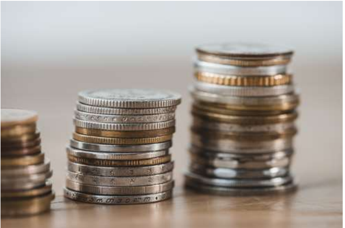
PSP Swiss Property hat 2022 operativ gut verdient

Zwar wertete das Portfolio auch im Jahr 2022 auf, nämlich um 124,9 Mio. CHF. Dieser Wert blieb aber deutlich hinter dem des Jahres 2021 (464,9 Mio.) zurück, was dazu führte, dass der Reingewinn der PSP um ganze 44,5%, auf 330,0 Mio. CHF absackte. Bei den jüngeren Aufwertungen spielte noch ein tieferer Diskontierungssatz hinein, aber auch einige vermietungen machten sich positiv bemerkbar.