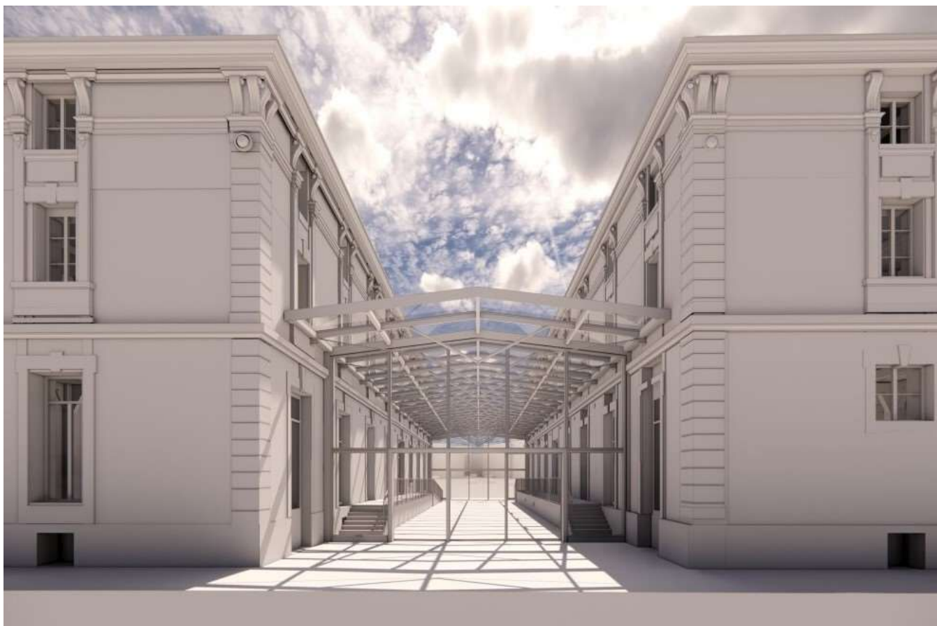
Das Mobimo-Projekt Les Jumeaux in Lausanne (Bild: FERRARIARCHITECTES)

Der Immobilienkonzern Mobimo weist für das Geschäftsjahr 2022 einen Gewinn von 135,3 Mio. CHF aus, das ist ein Minus von 2,9% gegenüber dem Vorjahr (139,4 Mio.). Ohne Neubewertungseffekte lag der Gewinn mit 102,3 Mio. CHF über dem Vorjahreswert von 96,7 Mio. CHF. Der Erfolg aus Neubewertung erreichte 44,3 Mio. CHF – gegenüber 53,3 Mio. CHF im Jahr 2021 (-16,9%).